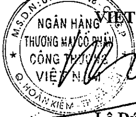
Lê Đức Thọ

TỔNG GIÁM ĐỐC NGÂN HÀNG TMCP CÔNG THƯƠNG